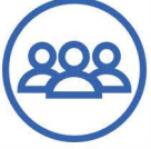
Personel Bordro Yönetimi